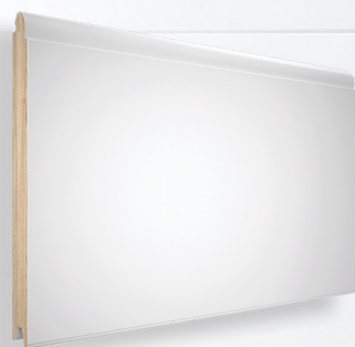
panel bez przetłoczeń