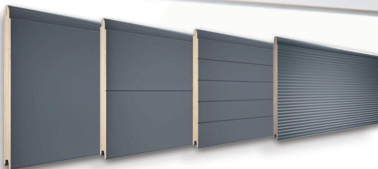
panel bez przetłoczeń